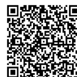
参加申込み用 QRコード

E-Mail isahaya-sen@niye.go.jp HP https://isahaya.niye.go.jp/