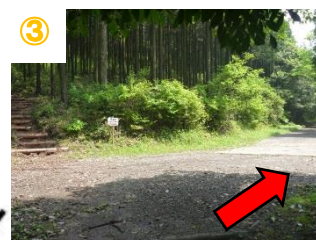
③ キャンプ村入口(右の道へ) (深海コース看板有り)