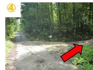
④ 分岐点(右の道へ) (深海コース看板有り)