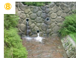
⑧ ゴール地点には砂防ダムがあり、落石の危険があるため水遊び・水浴びは禁止