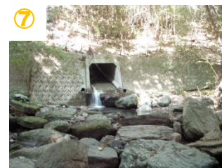
⑦ トンネルの中へ (右にエスケープルート有り) ※滑りやすい