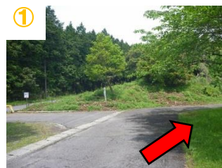
① 別館広場の上(右の道へ)