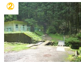
② 沢Aゴールからキャンプ村に向かって登る(看板有り) ※滑りやすい