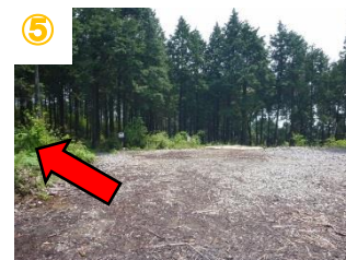
⑤ 分岐点(左の道へ) (深海コース看板有り) ※急な下りが続き、滑りやすい