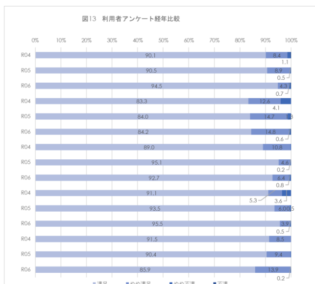
図13 利用者アンケート経年比較