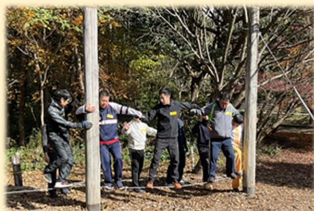
諫早コミュニケーションアドベンチャー プログラム (I-CAP)