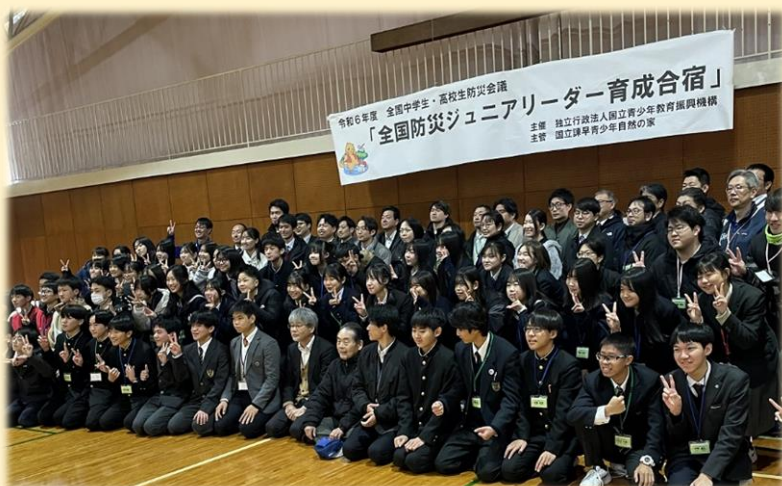
全国防災ジュニアリーダー育成合宿