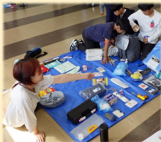
いさはや防災教育プログラム