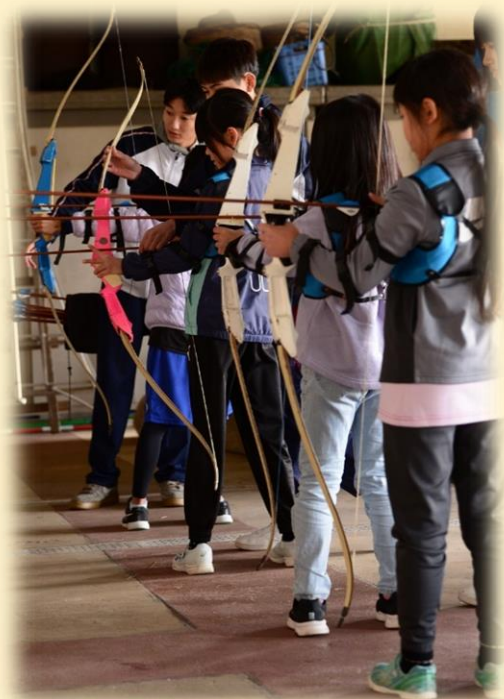
いさはやマルチスポーツ体験キャンプ