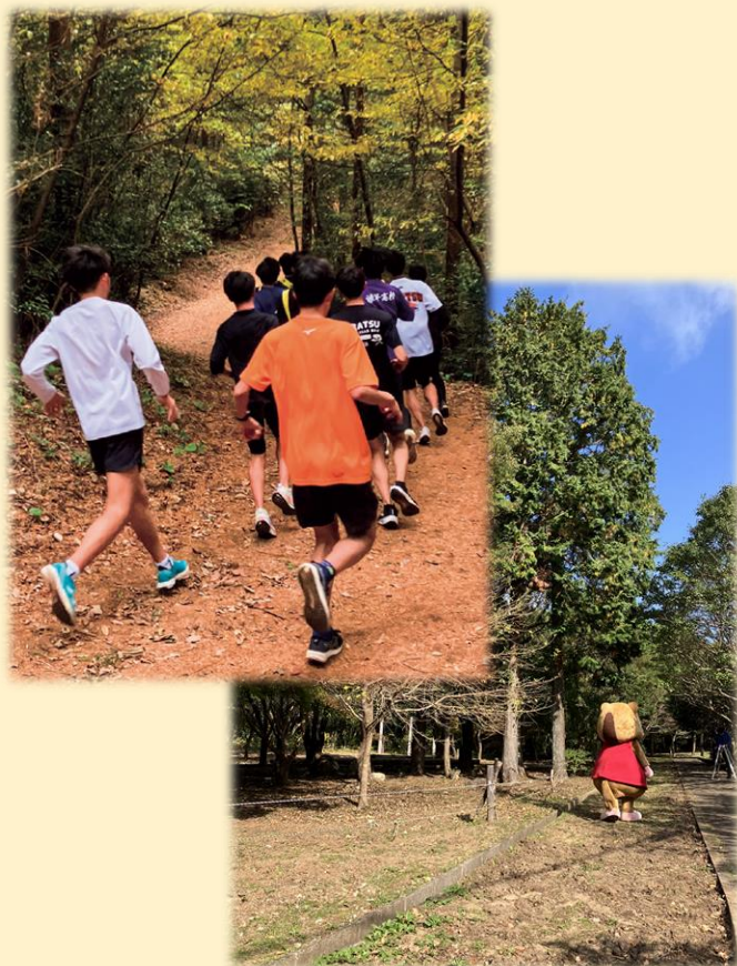
いさはや森のクロスカントリーコース